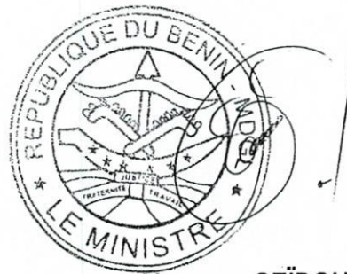
Alassane SEÏDOU Ministre de la Décentralisation et de la Gouvernance Locale